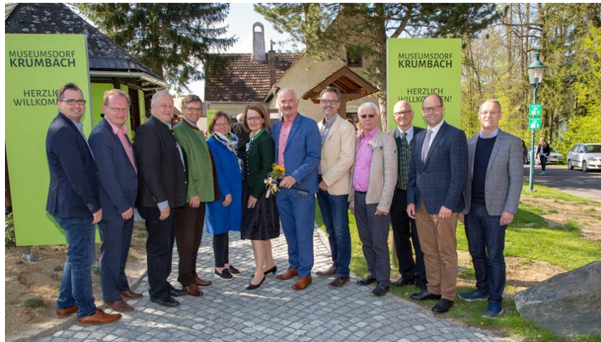
2019 - Eröffnung