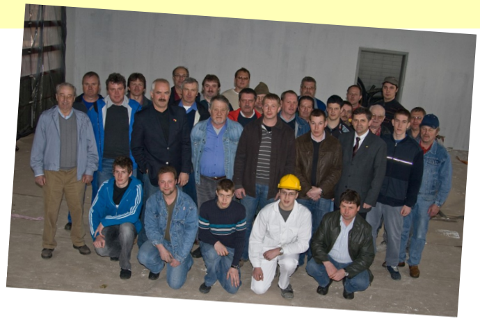
2007 - Zubau zum FF Haus Weißes Kreuz