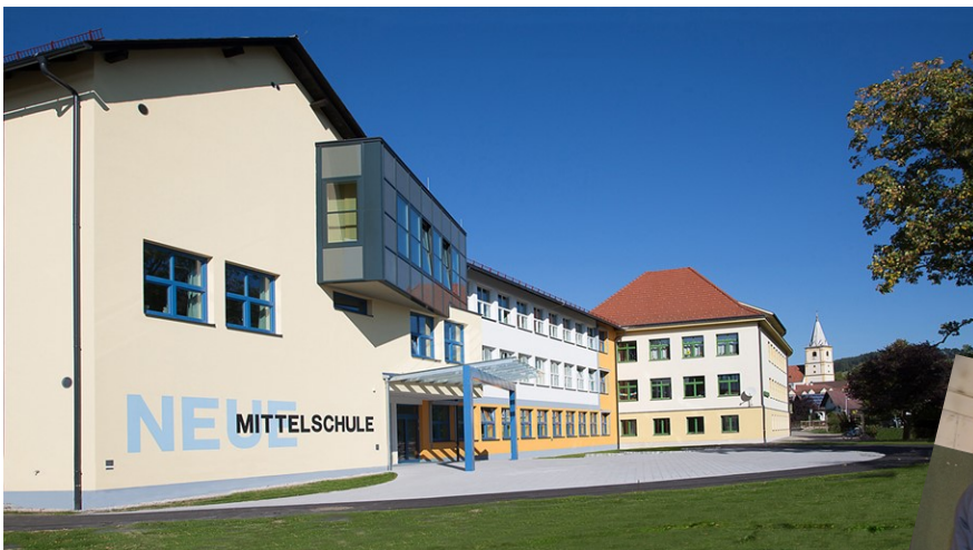
2016 - Eröffnung Sanierung Mittelschule