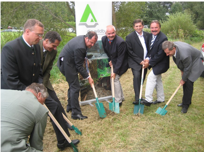
Rückhaltebecken Ponholz Spatenstich 2008