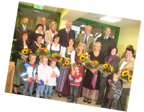
2008 - Erweiterung Kindergarten 2009 - Eröffnung