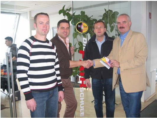
2007 - Fahrschule Easy Drivers