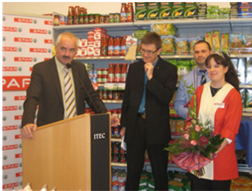
2009 - Spar-Eröffnung