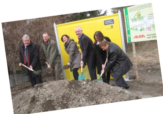
2010 - Spatenstich