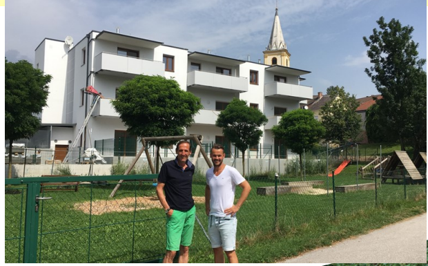
2017 - Schlüsselübergabe