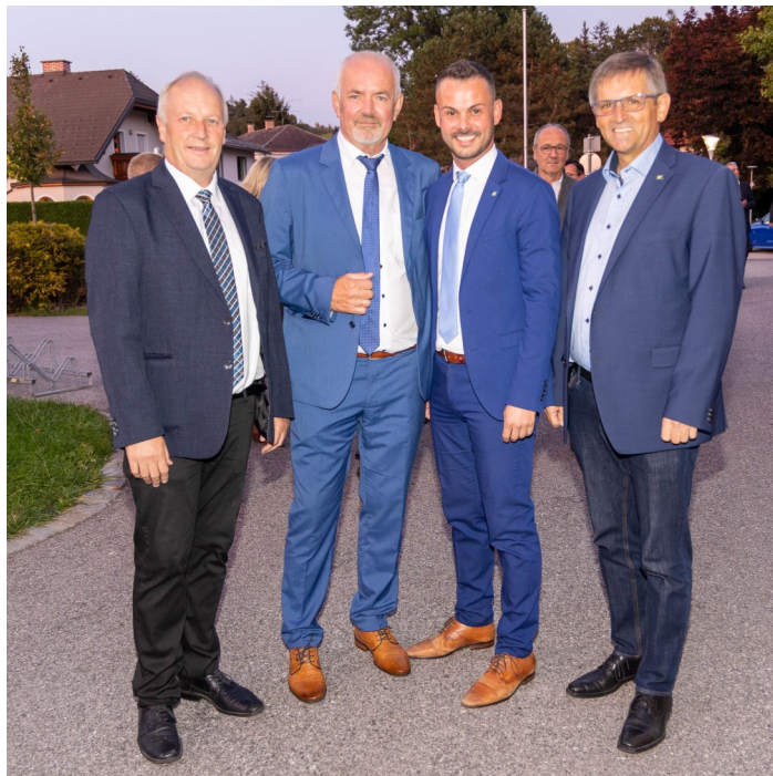
Am Foto von links: