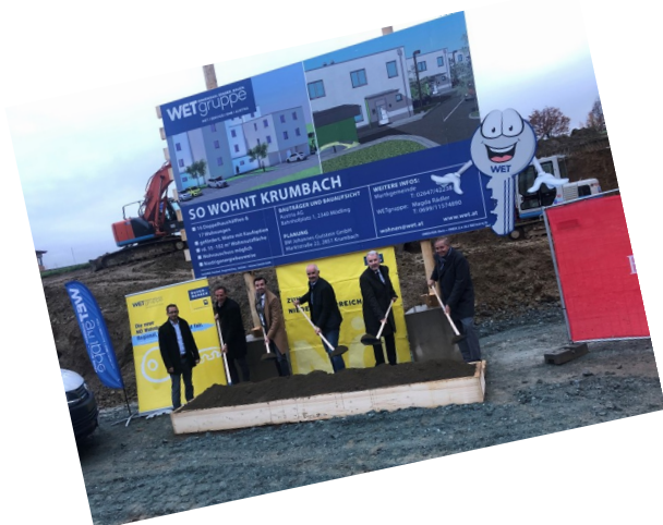
2020 - Spatenstich Wohnhausanlage