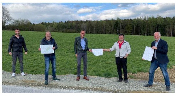
2021 - Neue Betriebsgründe