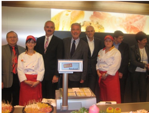
2010 - Billa-Eröffnung