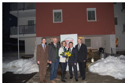
2013 - Einweihung