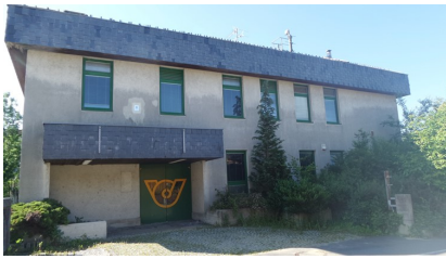
2016 - Alte Post wird zu Junges Wohnen