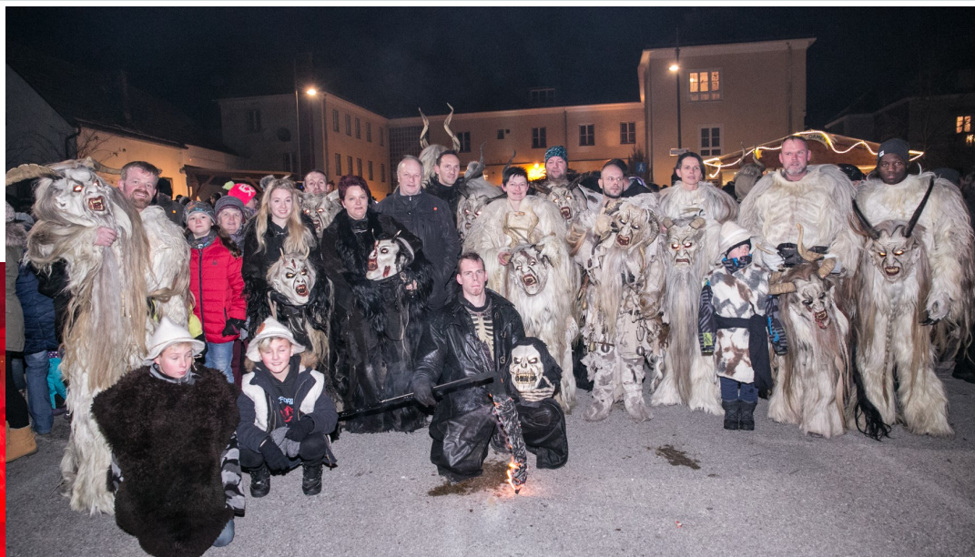
Am Foto: Krumbacher Schlossperchten

Am 3. Dezember fand der alljährliche Perchtenlauf - organisiert vom Wirtschaftsbund - am Gemeindeparkplatz statt.