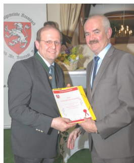
AHA Gastro Betriebs GmbH