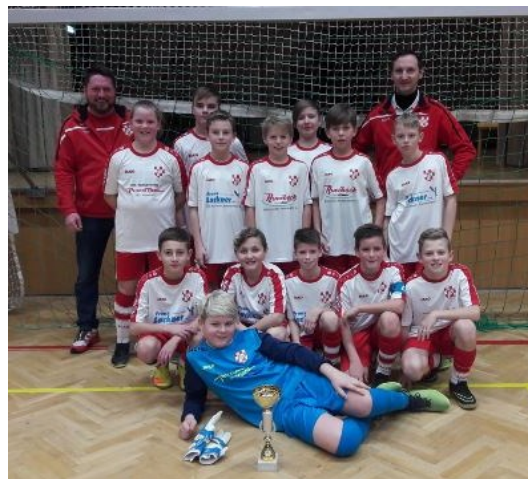
Die siegreiche U12 des USC Krumbach