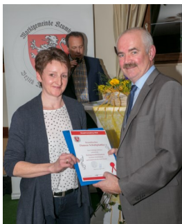
Krumbacher Damen Schuhplattler